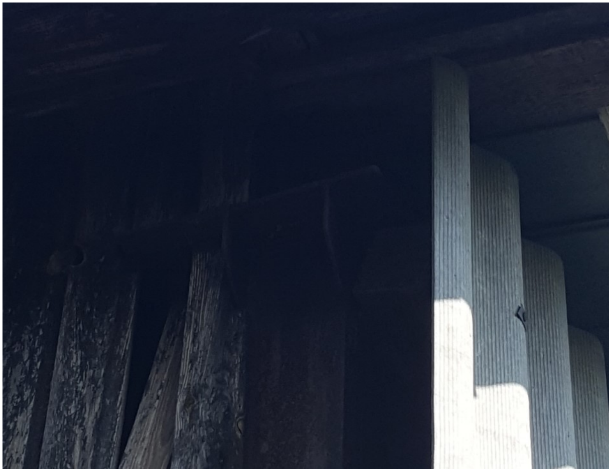
Rys. 4 Widok na podporę kratownicy na słupie 2C160

Elementy nośne są skorodowane w znaczącym stopniu, o różnej głębokości penetracji rdzy. Nie stwierdzono wyboczeń elementów, ani odchyleń od pionu.