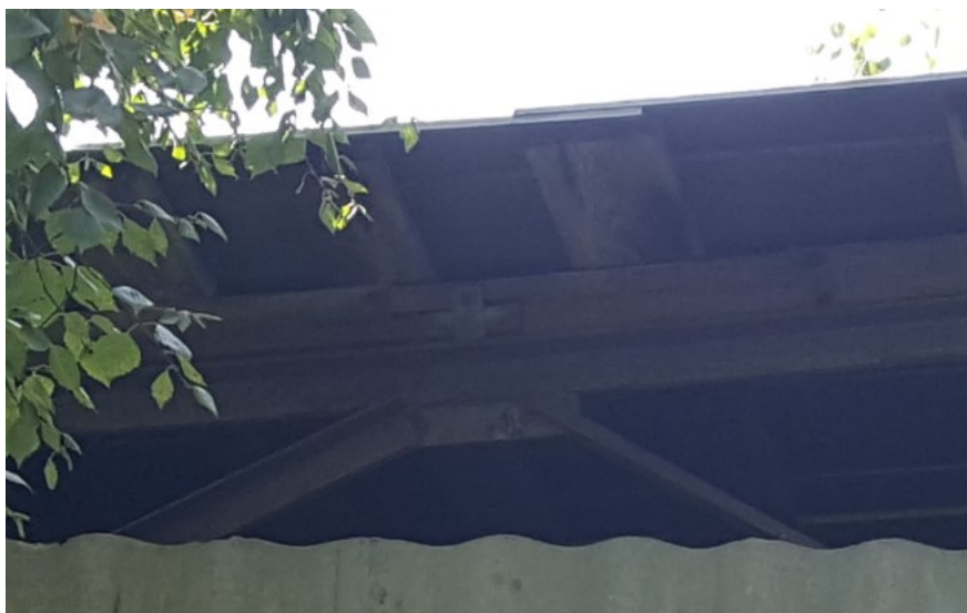
Rys. 5 Widok na węzeł kratownicy

Kratownice wykonane są z kątowników L60x60 (krzyżulce, pasy górne i dolne, część słupków). Połączenia krzyżulców, pasów i słupków w węzłach zapewnione są dzięki obustronnym blachom węzłowym o grubości ok. 0.5cm.