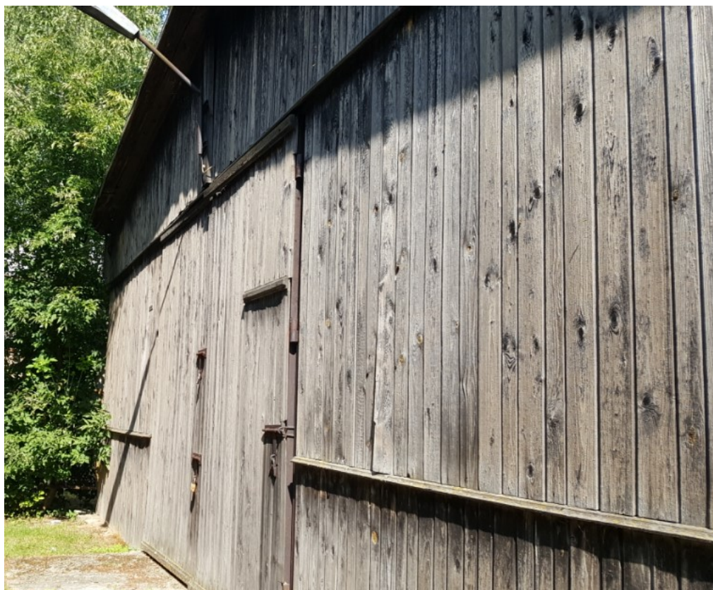
Rys. 7 Widok od frontu