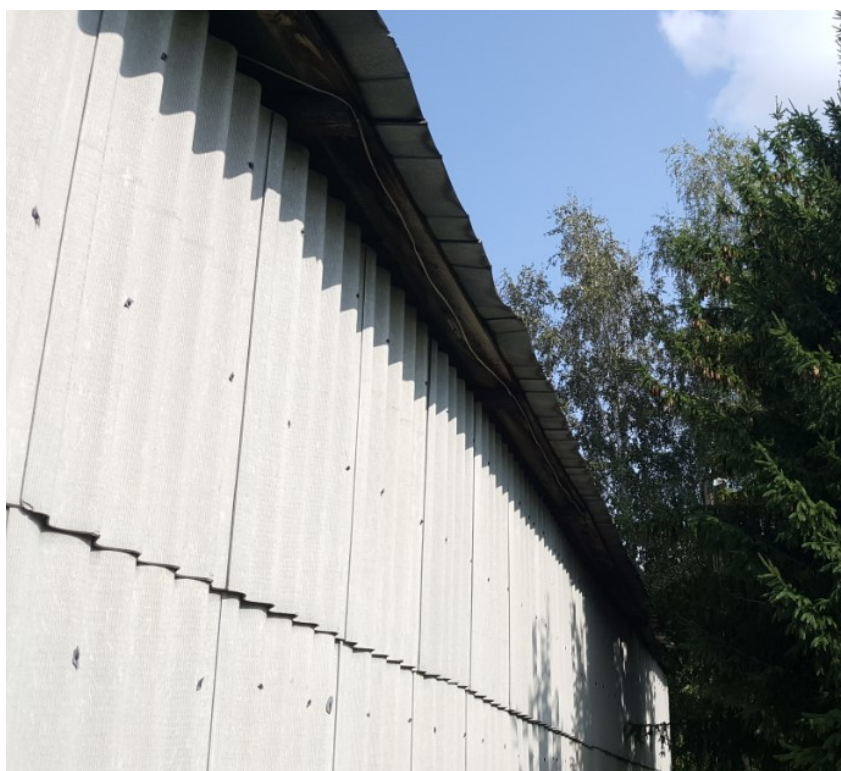
Rys. 9 Widok na elewację boczną