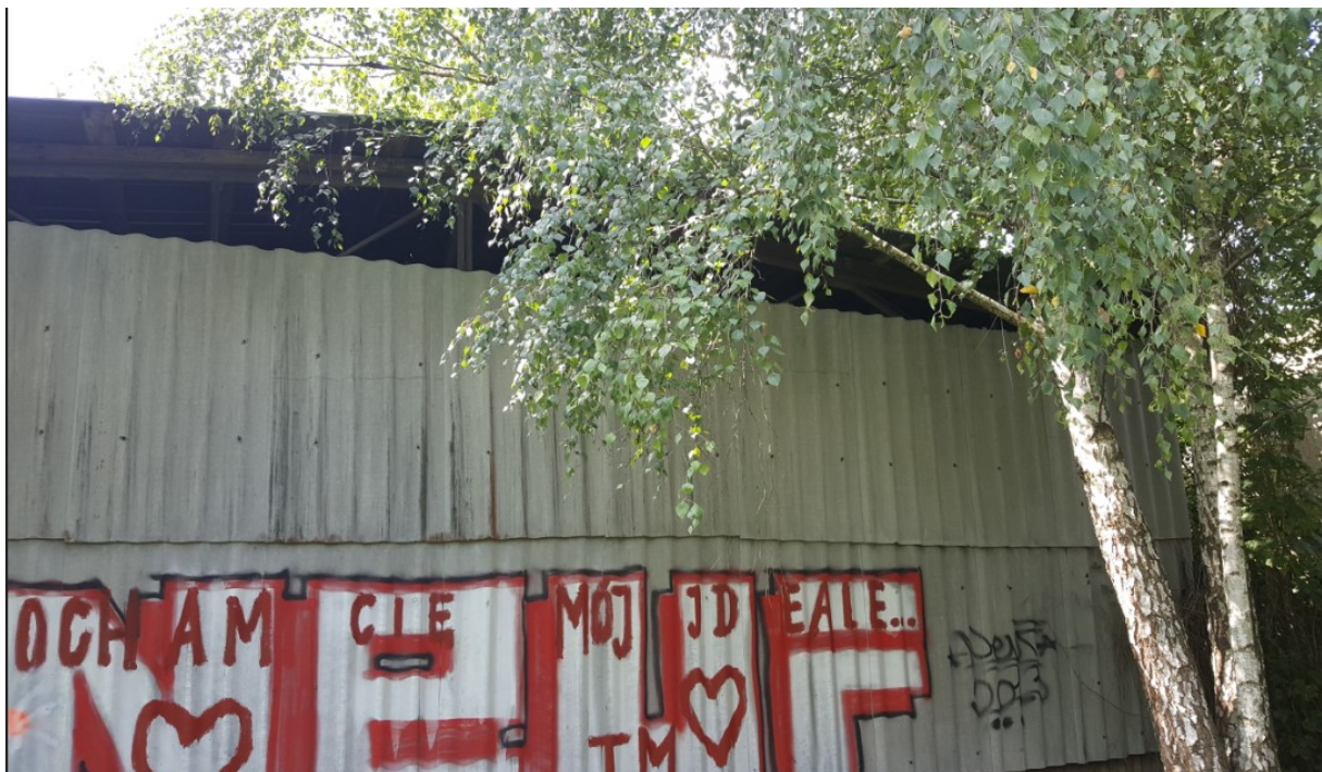
Rys. 8 Widok od tyłu