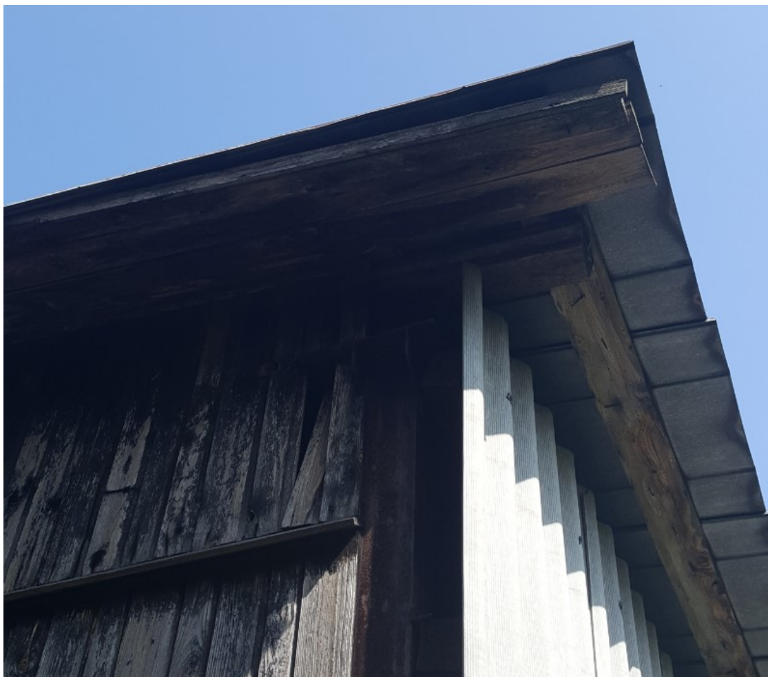
Rys. 6 Widok na płatwie i pokrycie dachowe

W oparciu o oględziny stwierdzono zauważalne ugięcia płatwi dachowych, szczególnie w rejonie złączy. Na elementach drewnianych stwierdzono lokalne pęknięcia oraz liczba przebarwienia, co świadczy o nieodpowiedniej wilgotności drewna i nieodpowiednie zabezpieczenie przed nią. Nie stwierdzono oznak działania owadów oraz występowania grzybów.