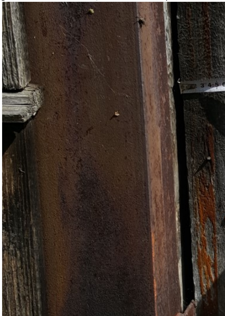
Rys. 3 Widok na połączenie dwóch ceowników C160

Ustrój nośny stanowią słupy stalowe 2C160, lokalizacja zgodnie z cz. graficzną opracowania. Ceowniki połączone są wykonanymi odcinkowo spoinami czołowymi o długościach ok. 20-25cm, co ok. 1mb słupa.