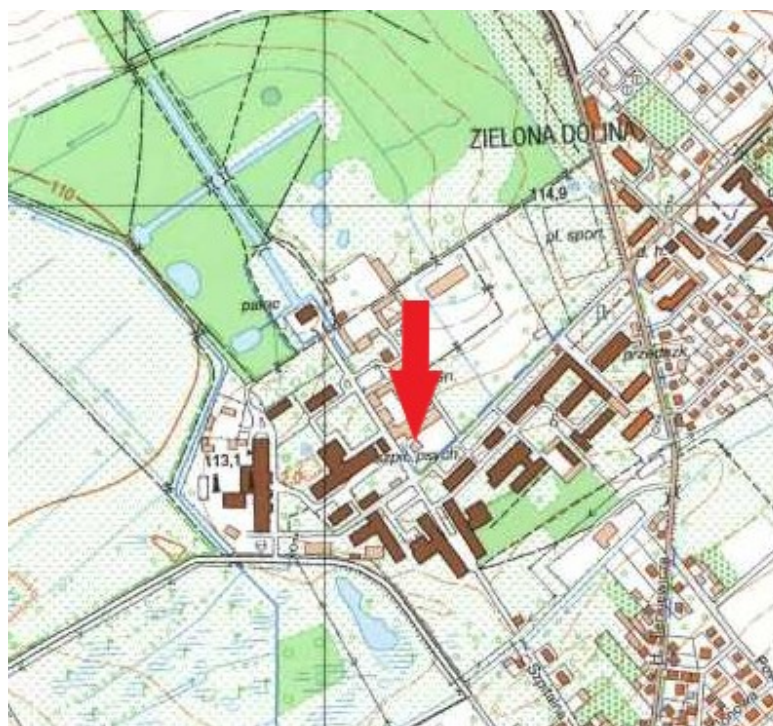
Rys. 1 Lokalizacja wiaty

Obiekt zlokalizowany jest na terenie Samodzielnego Publicznego Psychiatrycznego Zakładu Opieki Zdrowotnej w Choroszczy przy pl. im. dr Zygmunta Brodowicza 1.