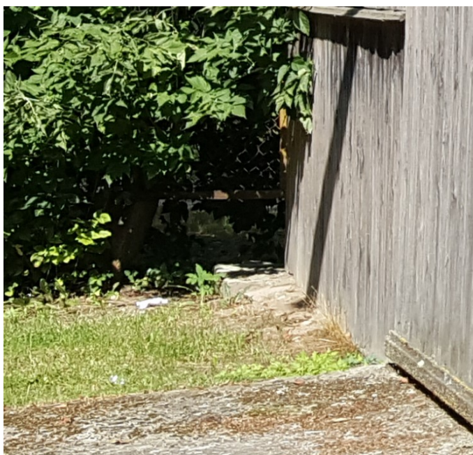
Rys. 2 Widok na odkryty fundament i posadzkę wjazdu

Nie stwierdzono nierównomiernego osiadania fundamentów oraz odkształceń układów poprzecznych mających negatywny wpływ na bezpieczeństwo konstrukcji wiaty.