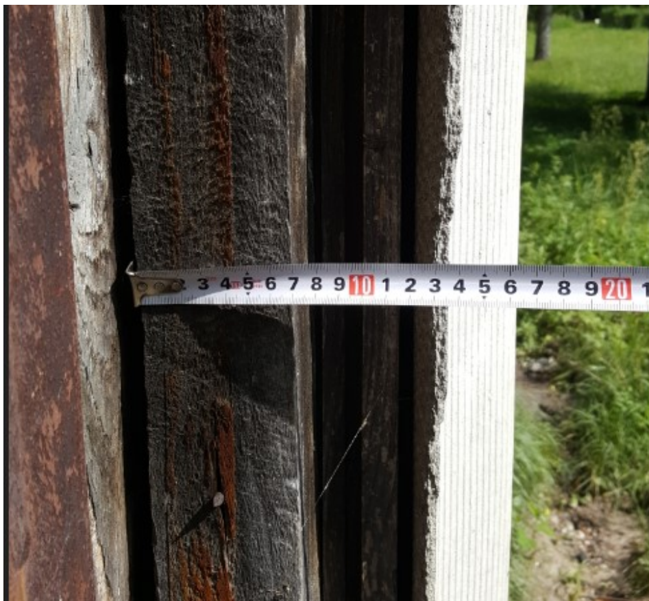
Rys. 5 Widok na warstwy obudowy ścian

Stwierdzono znaczne odkształcenia elementów rusztu drewnianego, lokalne pęknięcia i przebarwienia rusztu oraz okładziny drewnianej. Ponadto stwierdzono ubytki w obudowie z płyt eternitowych.